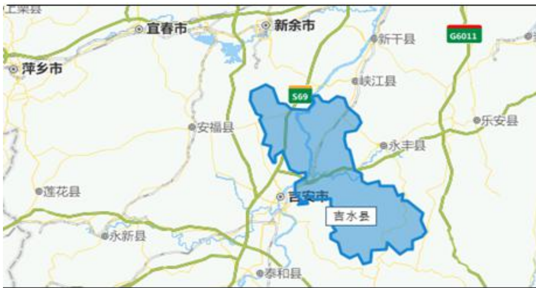
图 2：吉水县区位示意图

吉水县生态条件良好，农副产品资源丰富，是全国商品粮生产基地和全国优质大米生产基地之一，也是联合国粮农组织重点扶持的全国 18 个农业可持续发展试点县之一。吉水县松树、樟树、山苍子、柏木等林业资源丰富，森林覆盖率达 63.4%，为江西省湿地松及药材种植基地建设重点县。