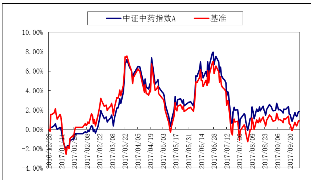
汇添富中证中药指数 C: