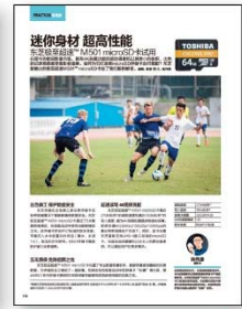
摄影之友2017年2-3执行明细