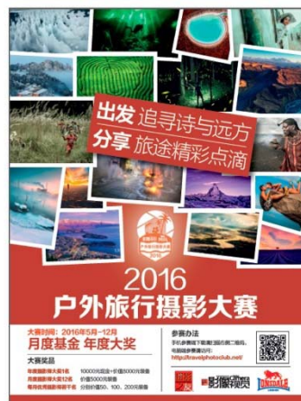
2016户外旅行摄影大赛/双周赛 排期明细