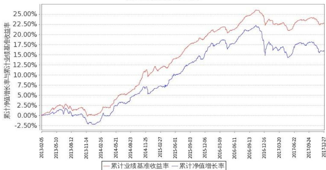
图 1：嘉实中证中期企业债指数（LOF）A 基金份额累计净值增长率与同期业绩比较基准收益率的历史走势对比图