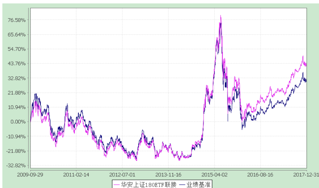
华安上证 180 交易型开放式指数证券投资基金联接基金 份额累计净值增长率与业绩比较基准收益率的历史走势对比图 (2009 年 9 月 29 日至 2017 年 12 月 31 日)