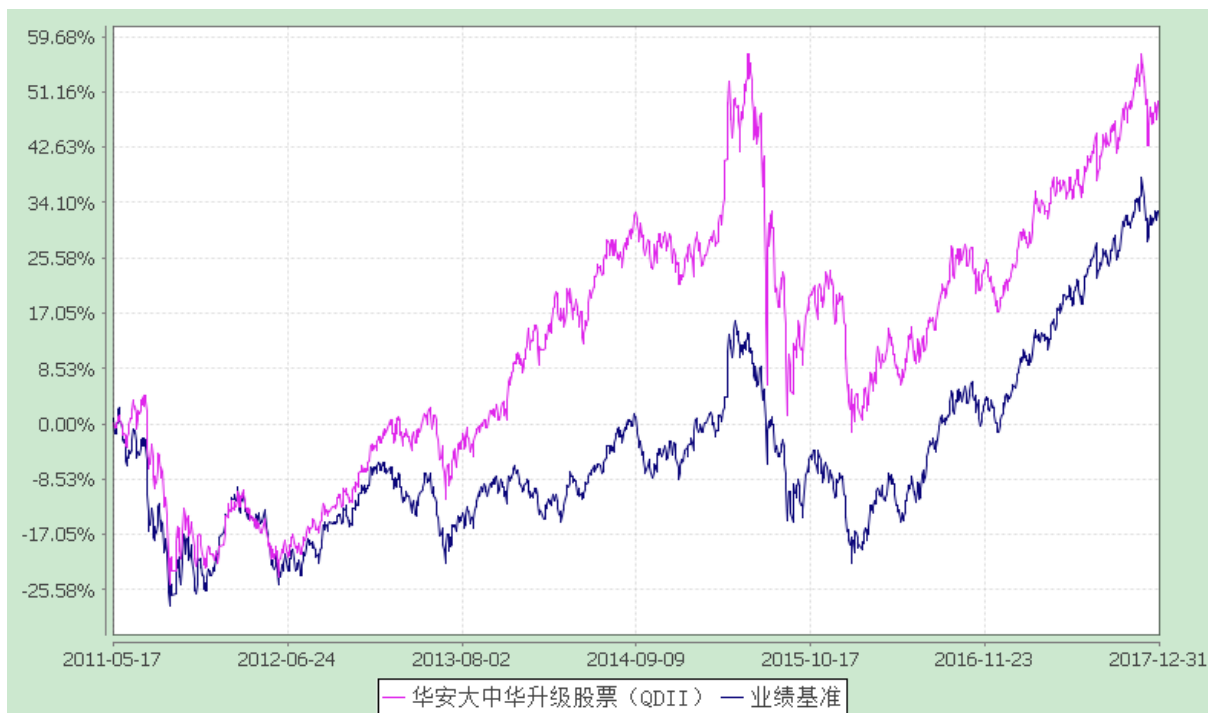
份额累计净值增长率与业绩比较基准收益率历史走势对比图 (2011 年 5 月 17 日至 2017 年 12 月 31 日)