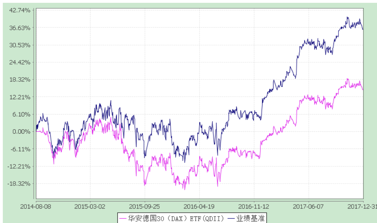
华安国际龙头（DAX）交易型开放式指数证券投资基金 份额累计净值增长率与业绩比较基准收益率历史走势对比图 (2014 年 8 月 8 日至 2017 年 12 月 31 日)