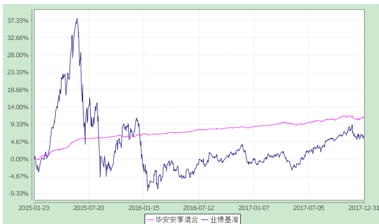
华安安享灵活配置混合型证券投资基金 份额累计净值增长率与业绩比较基准收益率的历史走势对比图 (2015 年 1 月 23 日至 2017 年 12 月 31 日)