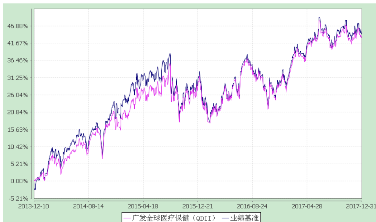
广发全球医疗保健指数证券投资基金 份额累计净值增长率与业绩比较基准收益率历史走势对比图 (2013 年 12 月 10 日至 2017 年 12 月 31 日)