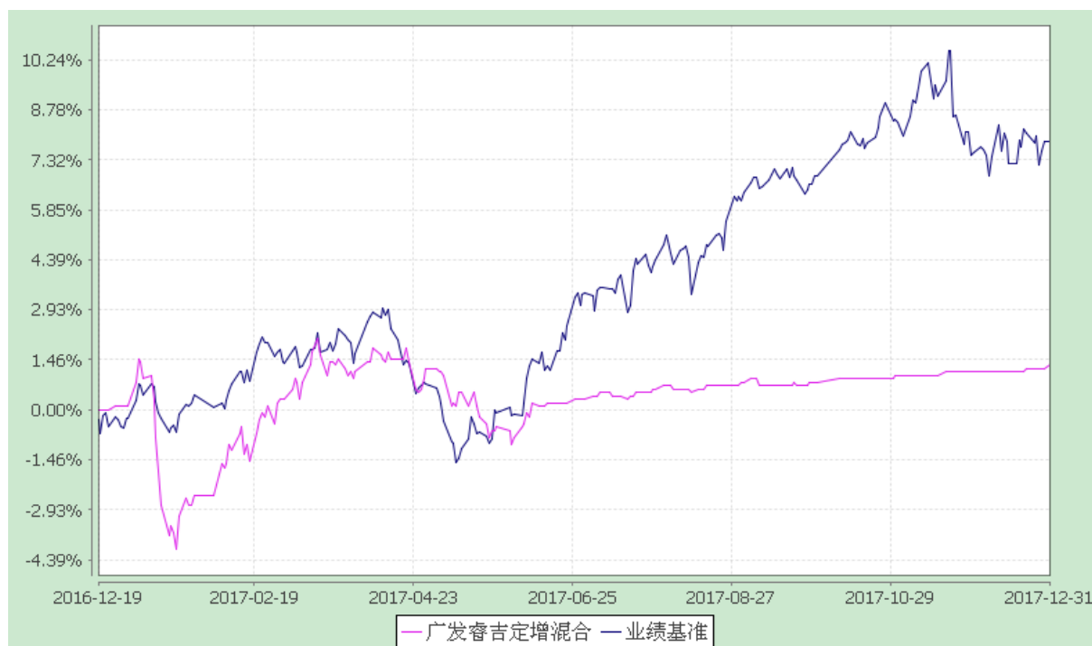
广发睿吉定增主题灵活配置混合型证券投资基金 份额累计净值增长率与业绩比较基准收益率的历史走势对比图 (2016 年 12 月 19 日至 2017 年 12 月 31 日)

注：本基金建仓期为基金合同生效后 6 个月，建仓期结束时各项资产配置比例符合本基金合同有关规定。