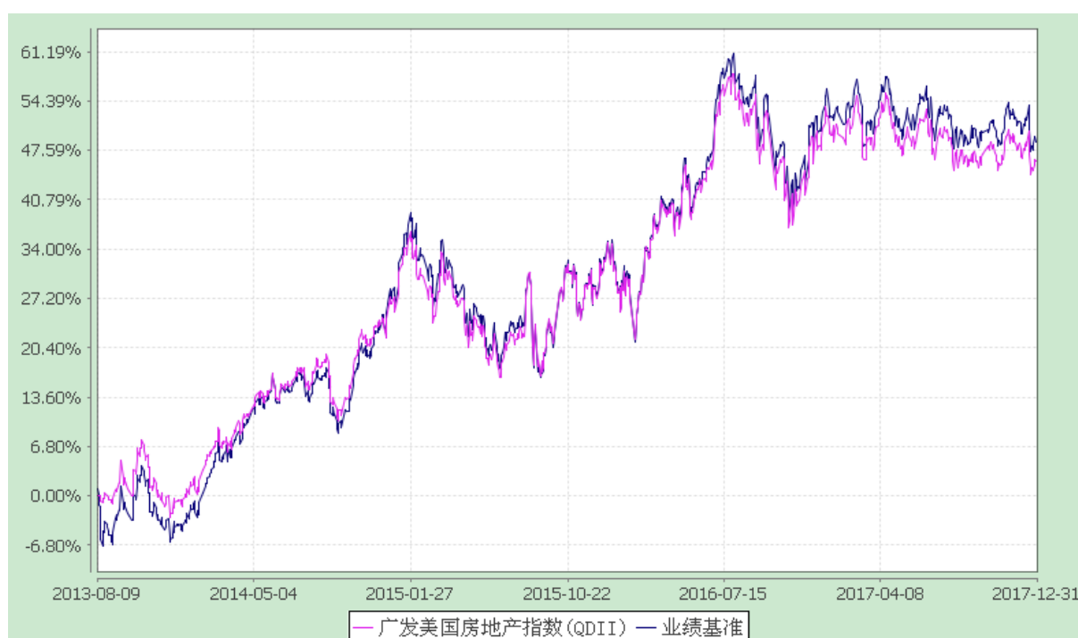
广发美国房地产指数证券投资基金 份额累计净值增长率与业绩比较基准收益率历史走势对比图 (2013 年 8 月 9 日至 2017 年 12 月 31 日)