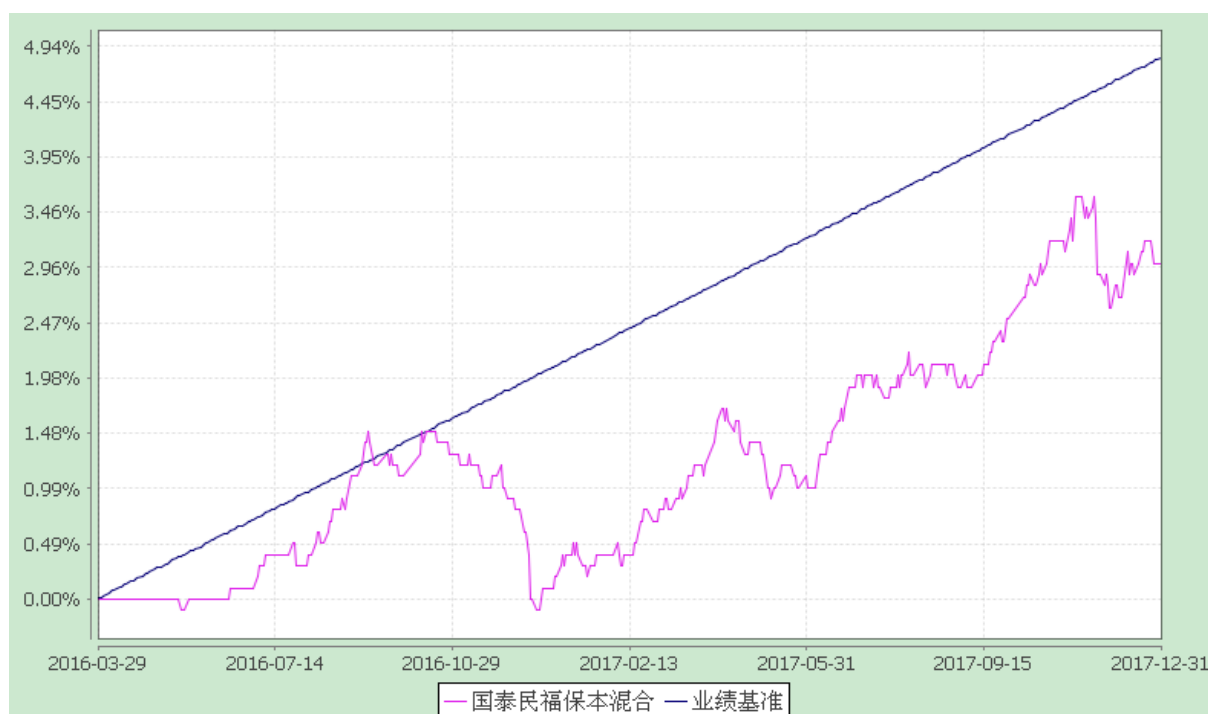
自基金合同生效以来份额累计净值增长率与业绩比较基准收益率的历史走势对比图 (2016年3月29日至2017年12月31日)