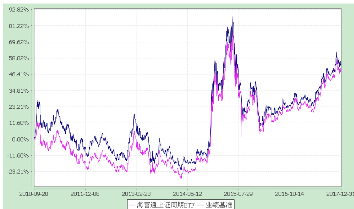
上证周期行业 50 交易型开放式指数证券投资基金 份额累计净值增长率与业绩比较基准收益率的历史走势对比图 (2010 年 9 月 19 日至 2017 年 12 月 31 日)

注：按照本基金合同规定，本基金建仓期为基金合同生效之日起三个月。截至报告期末本基金的各项投资比例已达到基金合同第十三章（二）投资范围、（六）投资限制中规定的各项比例。