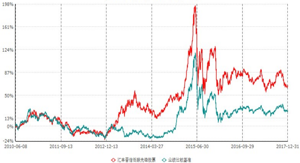
汇丰晋信低碳先锋股票型证券投资基金累计净值增长率与业绩比较基准收益率历史走势对比图 (2010年06月08日-2017年12月31日)

注：1. 按照基金合同的约定，本基金的投资组合比例为：股票投资比例范围为基金资产的85%-95%，权证投资比例范围为基金资产净值的0%-3%。固定收益类证券、现金和其他资产投资比例范围为基金资产的5%-15%，其中现金或到期日在一年以内的政府债券的投资比例不低于基金资产净值的5%。本基金自基金合同生效日起不超过六个月内完成建仓。截止2010年12月8日，本基金的各项投资比例已达到基金合同约定的比例。