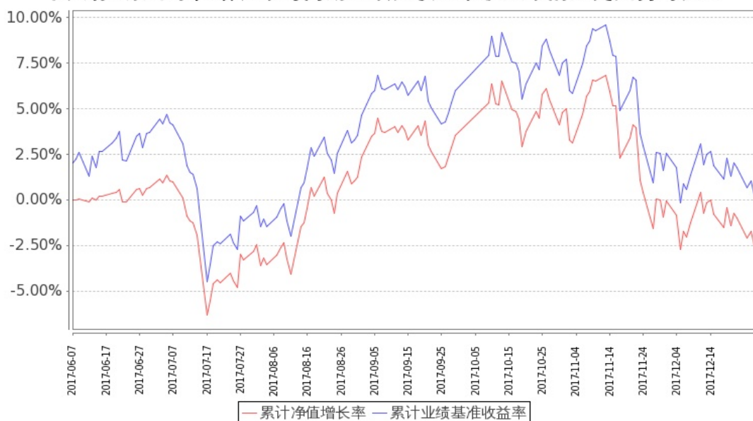
图：嘉实中关村 A 股 ETF 基金份额累计净值增长率与同期业绩比较基准收益率的历史走势对比图