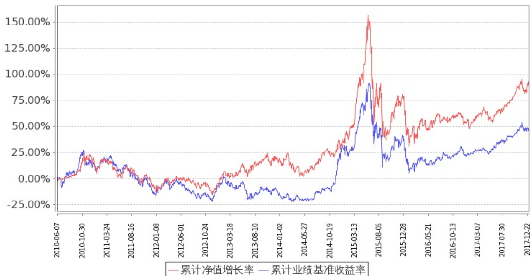
图：嘉实价值优势混合基金份额累计净值增长率与同期业绩比较基准收益率的历史走势对比图 (2010年6月7日至2017年12月31日)

注：1. 按基金合同和招募说明书的约定，本基金自基金合同生效日起6个月内为建仓期，建仓期结束时本基金的各项投资比例符合基金合同（十四（二）投资范围和（七）2、基金投资组合比例限制）的有关约定。