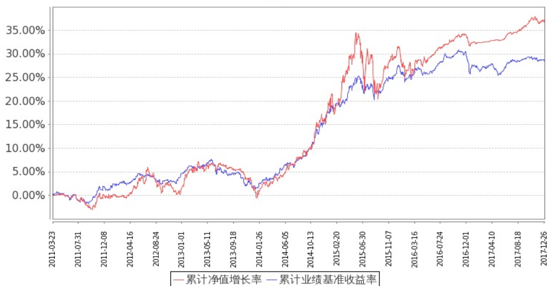
图：嘉实多利分级债券基金份额累计净值增长率与同期业绩比较基准收益率的历史走势对比图 (2011年3月23日至2017年12月31日)

注：按基金合同和招募说明书的约定，本基金自基金合同生效日起6个月内为建仓期，建仓期结束时本基金的各项投资比例符合基金合同（十六（二）投资范围和（五）投资限制 2. 基金投资组合限制）的有关约定。