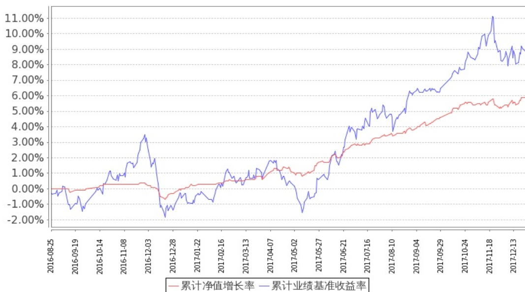
图：嘉实安益混合份额累计净值增长率与同期业绩比较基准收益率的历史走势对比图