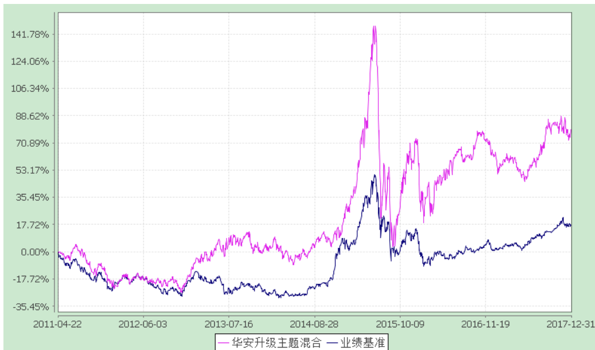
自基金合同生效以来份额累计净值增长率与业绩比较基准收益率的历史走势对比图 (2011 年 4 月 22 日至 2017 年 12 月 31 日)