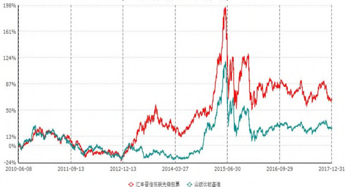
汇丰晋信低碳先锋股票型证券投资基金累计净值增长率与业绩比较基准收益率历史走势对比图 (2010年06月08日-2017年12月31日)

注：1. 按照基金合同的约定，本基金的投资组合比例为：股票投资比例范围为基金资产的85%-95%，权证投资比例范围为基金资产净值的0%-3%。固定收益类证券、现金和其他