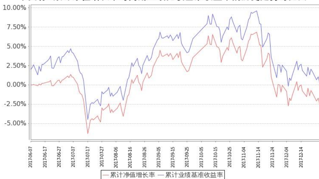
图：嘉实中关村 A 股 ETF 基金份额累计净值增长率与同期业绩比较基准收益率