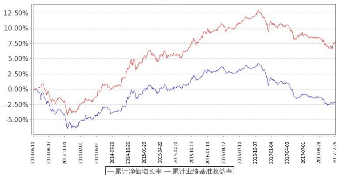
图：嘉实中证中期国债 ETF 基金份额累计净值增长率与同期业绩比较基准收益率的历史走势对比图