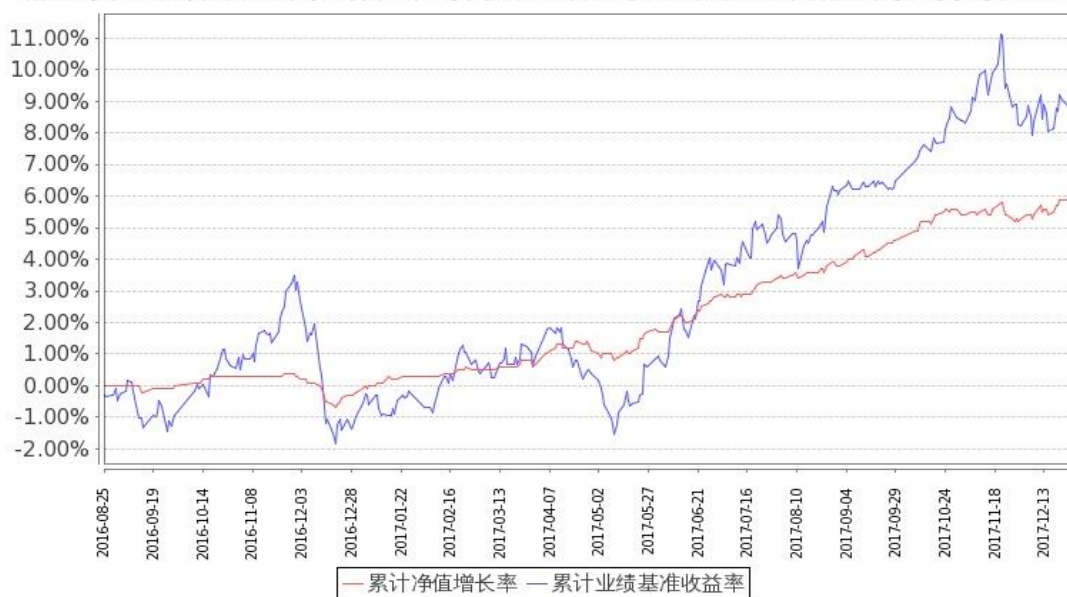
图：嘉实安益混合份额累计净值增长率与同期业绩比较基准收益率的历史走势对比图