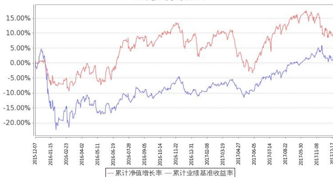
图：嘉实腾讯自选股大数据策略股票基金份额累计净值增长率与同期业绩比较基准收益率的历史走势对比图