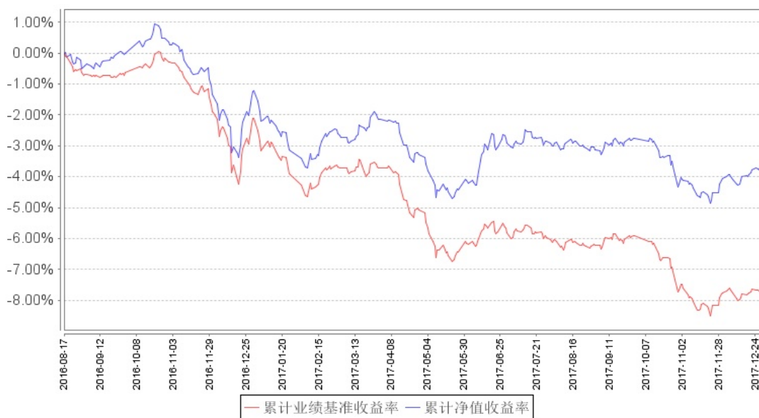
南方 10 年国债 A 累计净值增长率与同期业绩比较基准收益率的历史走势对比图