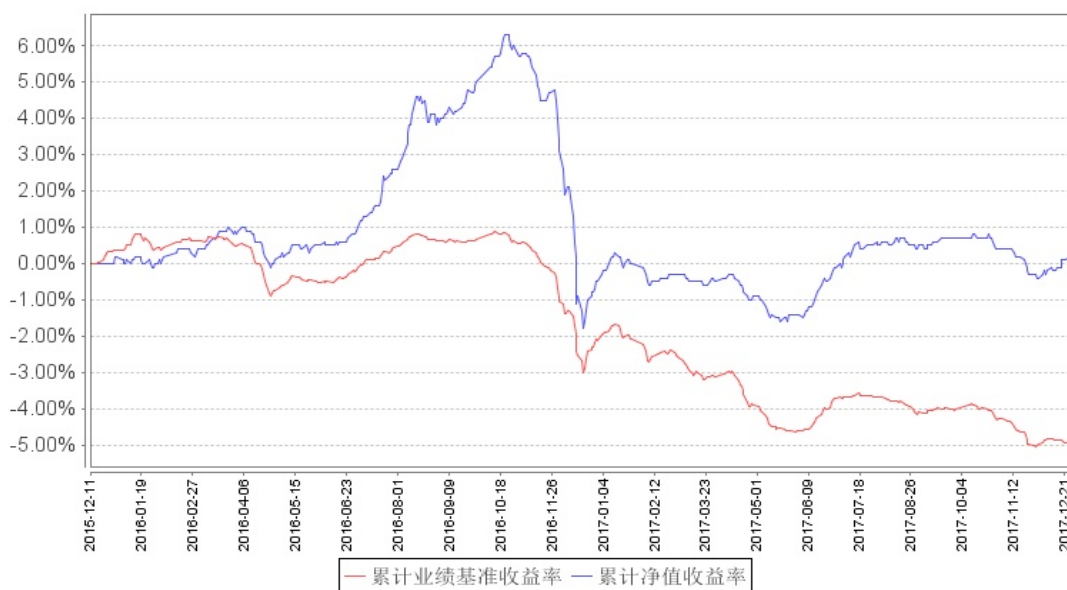
南方弘利A累计净值增长率与同期业绩比较基准收益率的历史走势对比图