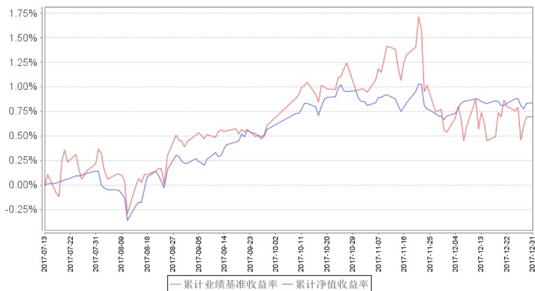
南方荣年A累计净值增长率与同期业绩比较基准收益率的历史走势对比图