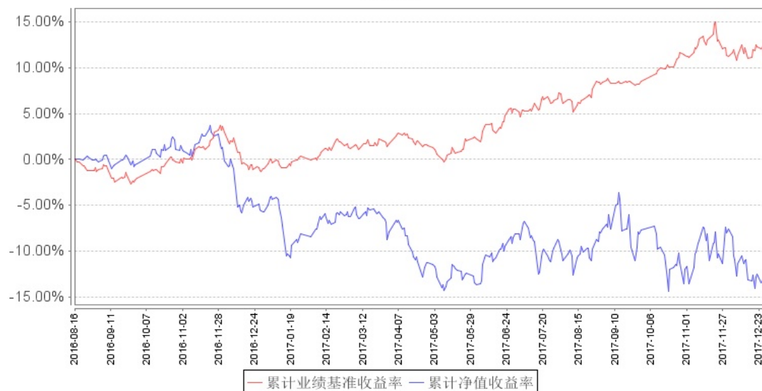
南方转型增长灵活配置混合累计净值增长率与同期业绩比较基准收益率的历史走势对比图

注：本基金的基金合同生效日为 2016 年 8 月 17 日，本基金建仓期为 6 个月，建仓期结束时各项资产配置比例符合基金合同约定。