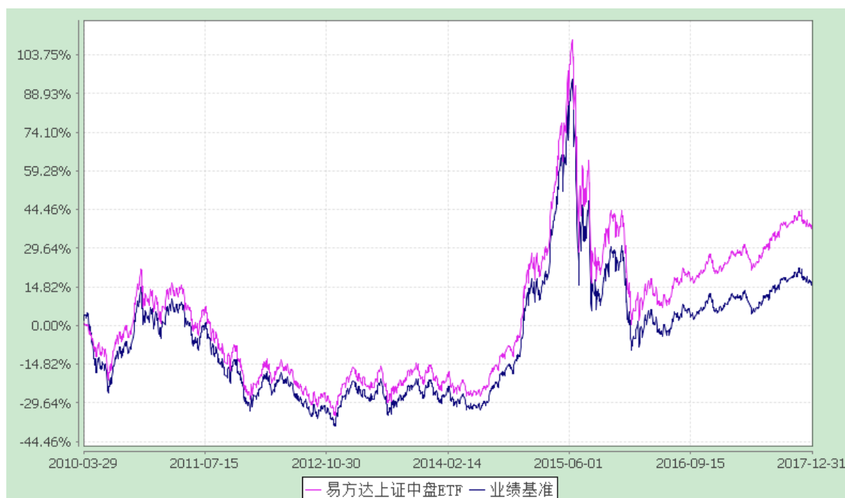
易方达上证中盘交易型开放式指数证券投资基金 份额累计净值增长率与业绩比较基准收益率历史走势对比图 (2010年3月29日至2017年12月31日)

注：自基金合同生效至报告期末，基金份额净值增长率为 38.36%，同期业绩比较基准收益率为 16.92%。