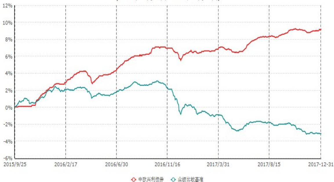
中欧兴利债券型证券投资基金累计净值增长率与业绩比较基准收益率历史走势对比图 (2015年09月25日-2017年12月31日)