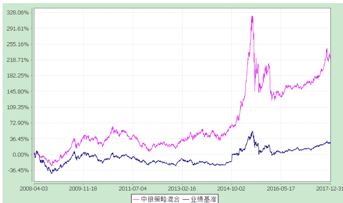
中银动态策略混合型证券投资基金 份额累计净值增长率与业绩比较基准收益率的历史走势对比图 (2008 年 4 月 3 日至 2017 年 12 月 31 日)

注：按基金合同规定，本基金自基金合同生效起 6 个月内为建仓期，截至建仓结束时本基金的各项投资比例已达到基金合同第十一部分（二）的规定，即本基金投资组合中，股票投资的比例范围为基金资产的 60%—95%；债券、权证、资产支持证券、货币市场工具及国家证券监管机构允许基金投资的其他金融工具占基金资产的比例范围为 0—40%；其中现金或者到期日在一年以内的政府债券不低于基金资产净值的 5%，持有权证的市场不超过基金资产净值的 3%。对于中国证监会允许投资的其他金融产品，将依据有关法律法规进行投资管理。