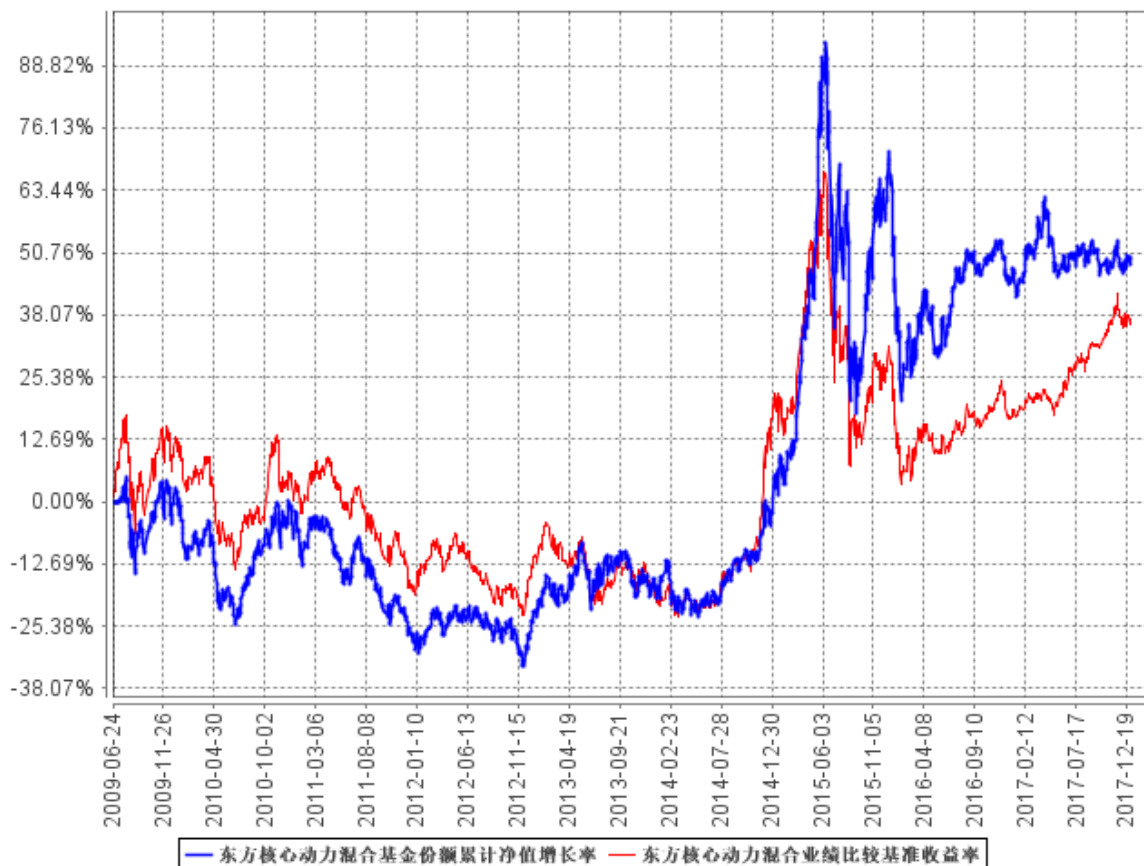
东方核心动力混合基金份额累计净值增长率与同期业绩比较基准收益率的历史走势对比图