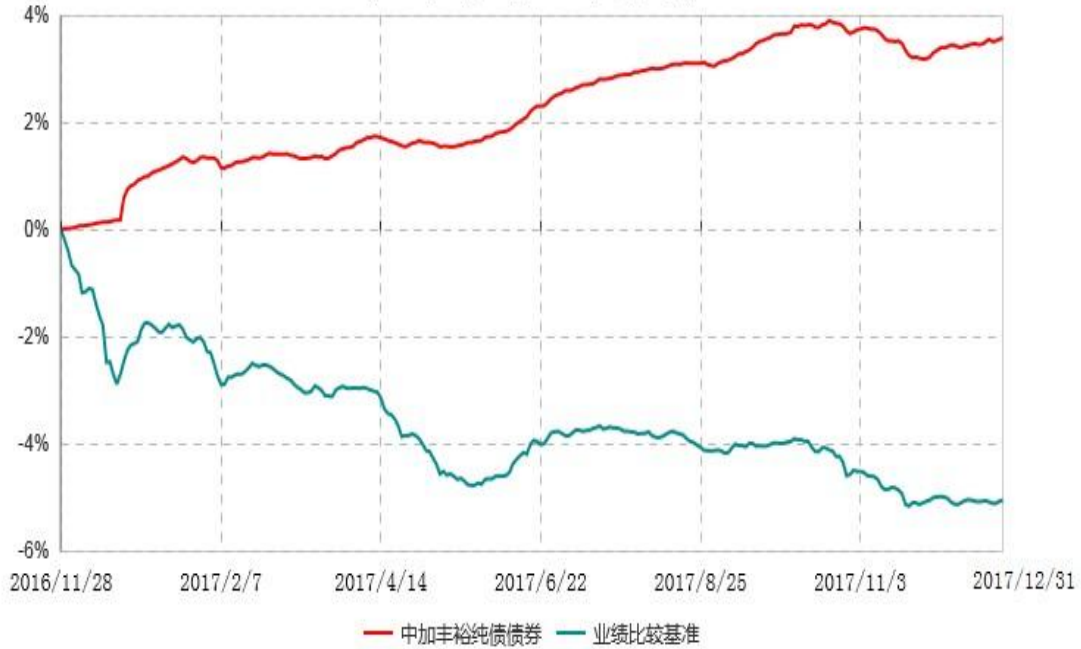
中加丰裕纯债债券型证券投资基金累计净值增长率与业绩比较基准收益率历史走势对比图 (2016年11月28日-2017年12月31日)