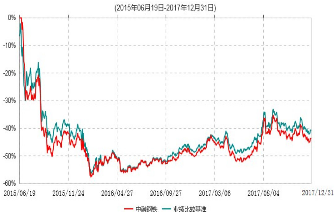
中融国证钢铁行业指数分级证券投资基金累计净值增长率与业绩比较基准收益率历史走势对比图

注：按基金合同和招募说明书的约定，本基金自基金合同生效日起6个月内为建仓期，建仓期结束时本基金的各项投资比例符合基金合同的有关约定。