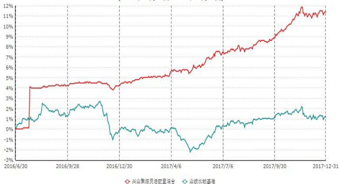
兴业聚源灵活配置混合型证券投资基金累计净值增长率与业绩比较基准收益率历史走势对比图 (2016年06月30日-2017年12月31日)

注：本基金基金合同于2016年6月30日生效，根据本基金基金合同规定，本基金自基金合同生效之日起六个月内已使基金的投资组合比例符合基金合同的约定。