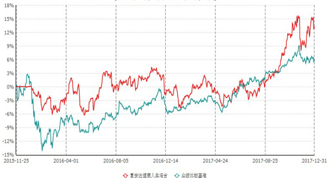
富安达健康人生灵活配置混合型证券投资基金累计净值增长率与业绩比较基准收益率历史走势对比图 (2015年11月25日-2017年12月31日)

根据《富安达健康人生灵活配置混合型证券投资基金基金合同》规定，本基金建仓期为6个月，建仓截止日为2016年5月24日。建仓期结束时本基金各项资产配置比例符合本基金合同规定的比例限制及投资组合的比例范围。