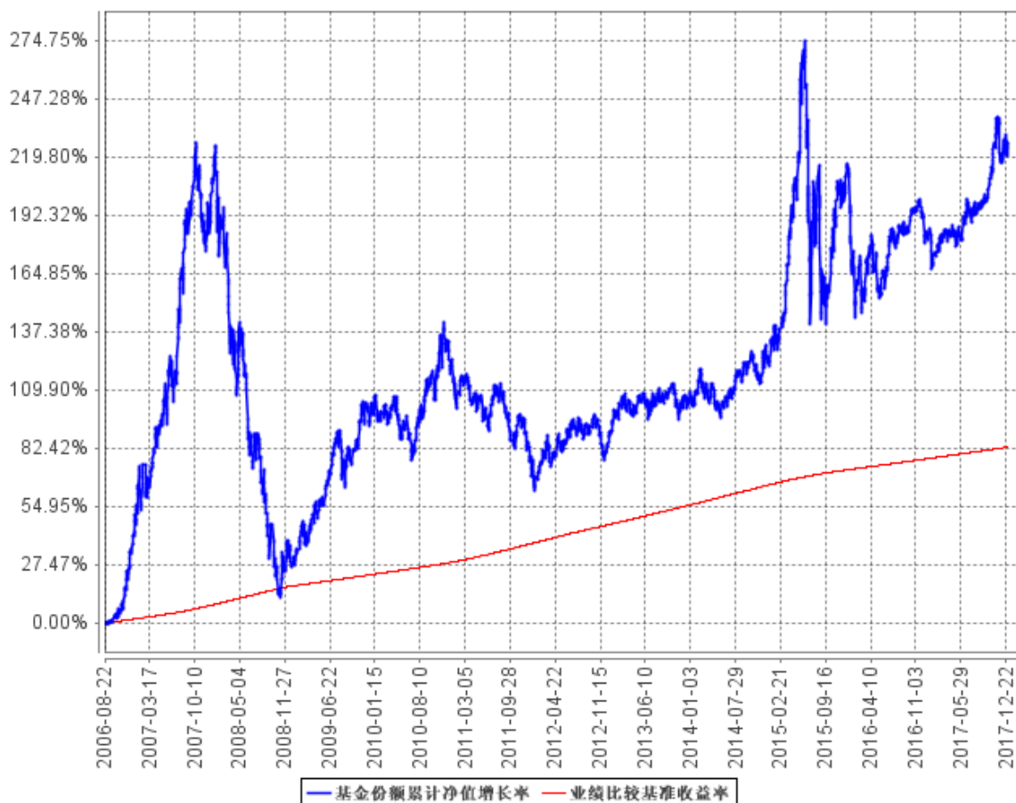
基金份额累计净值增长率与同期业绩比较基准收益率的历史走势对比图

注：本基金合同规定本基金投资组合为：股票投资比例为基金净资产的 10%—85%；权证投资比例为基金净资产的 0%—3%；债券投资比例为基金净资产的 10%—85%；现金或者到期日在一年以内的政府债券为基金净资产的 5%以上。本基金的建仓期为自本基金基金合同生效日起 6 个月，建仓期满时，各项资产配置比例符合基金合同约定。