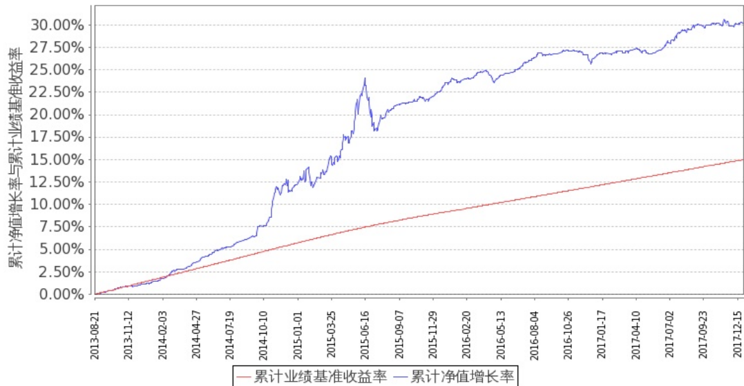
图 1：嘉实丰益信用定期债券 A 基金份额累计净值增长率与同期业绩比较基准收益率的历史走势对比图