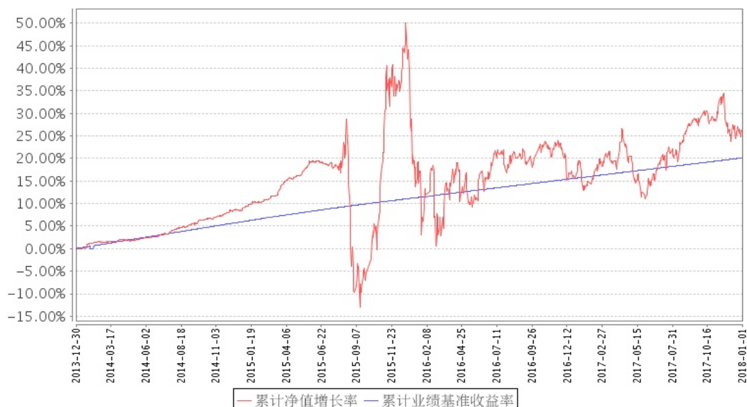
安信鑫发优选混合累计净值增长率与同期业绩比较基准收益率的历史走势对比图