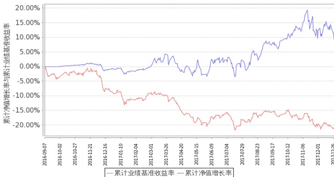
图 1：嘉实文体娱乐股票 A 基金累计份额净值增长率与同期业绩比较基准收益率的历史走势对比图