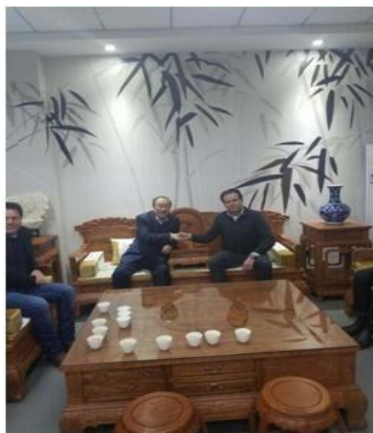
2017年2月荷兰马铃薯专家到我公司考察生物有机肥马铃薯专用肥 2017年3月荷兰马铃薯专家到我公司签署合作协议。