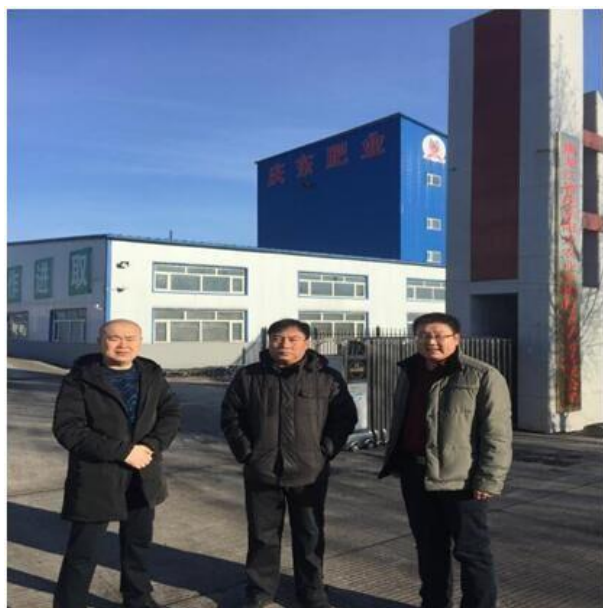
2017年1月省绿办到企业年审。已经通过并发证