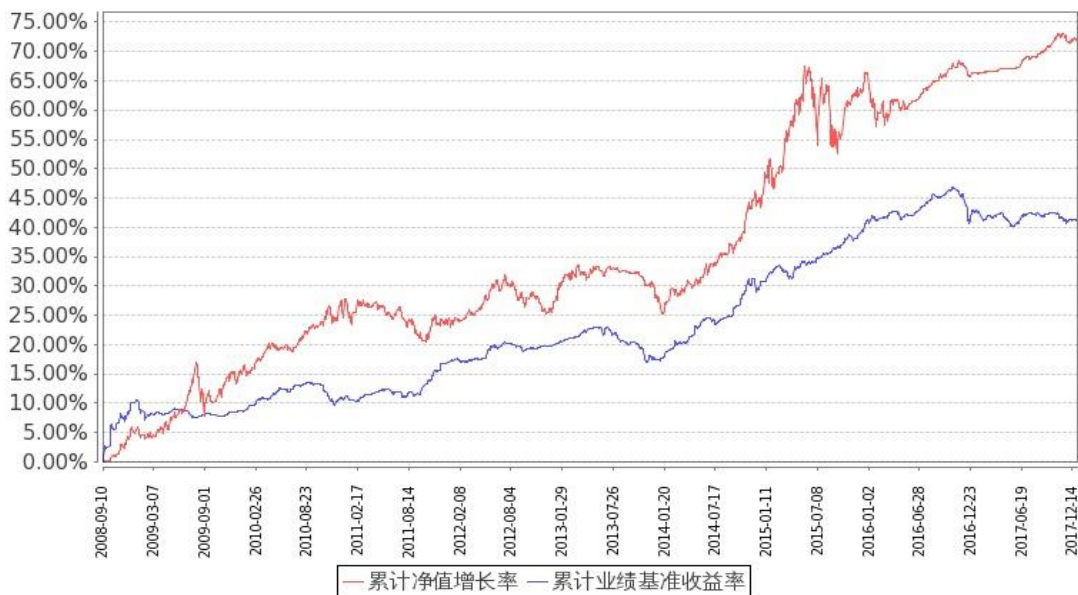
图 2：嘉实多元债券 B 基金份额累计净值增长率与同期业绩比较基准收益率的历史走势对比图