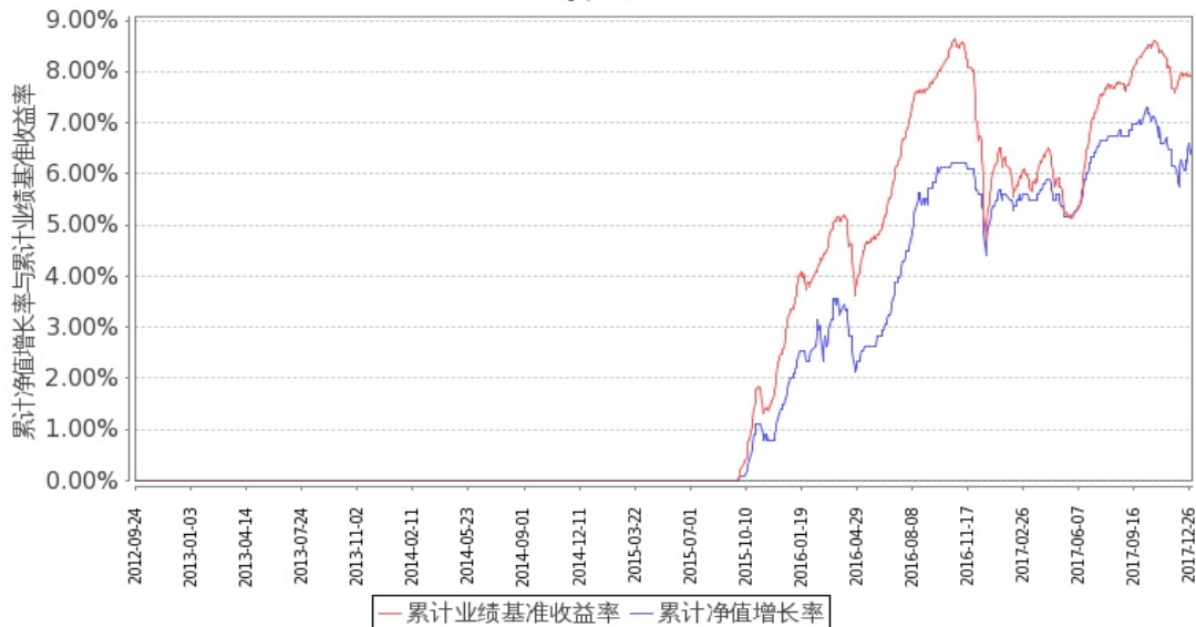
图 2：嘉实增强收益定期债券 C 基金份额累计净值增长率与同期业绩比较基准收益率的历史走势对比图