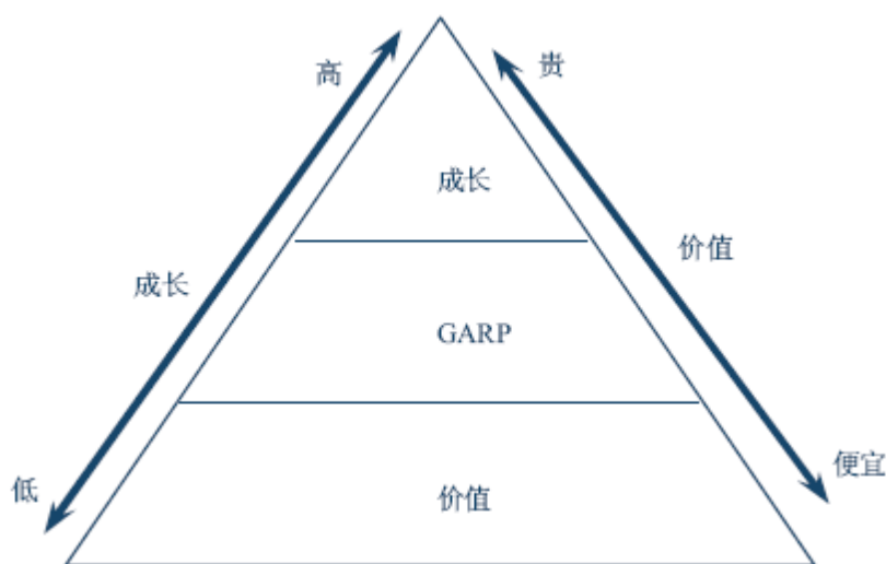
图 1 GARP 投资理念

② 对价值型公司的成长属性进行分析，可以发现相对投资价值较具成长性的股票，在成长潜力释放的过程中获得收益，规避市场价格未合理反映其成长性不足的股票。