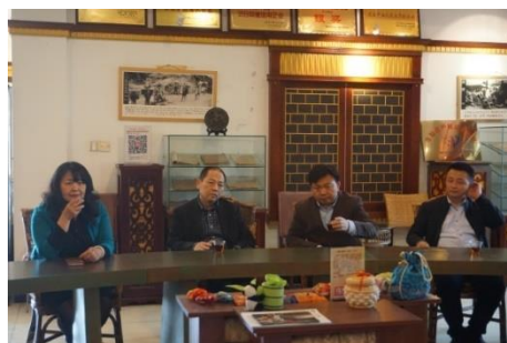
3月15日,省商务厅长刘欣,市委常委、副市长葛书院赴我公司调研。