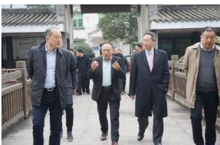
3月6日,市委书记兰开驰率市区有关领导再次到公司实地调研指导中国藏茶城的建设。