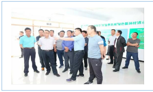
2018 年 6 月 25 日，青海省青海省海南藏族自治州委副书记、统战部部长更藏一行在锡林郭勒盟副盟长曲卫国的陪同下来到草都公司锡盟毛登基地考察