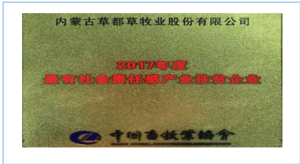
2018 年 5 月 18 日，由中国畜牧业协会主办的“2018 中国畜牧行业表彰活动”在重庆国际博览中心举行。草都草公司荣获“2017 年度最有社会责任感产业扶贫