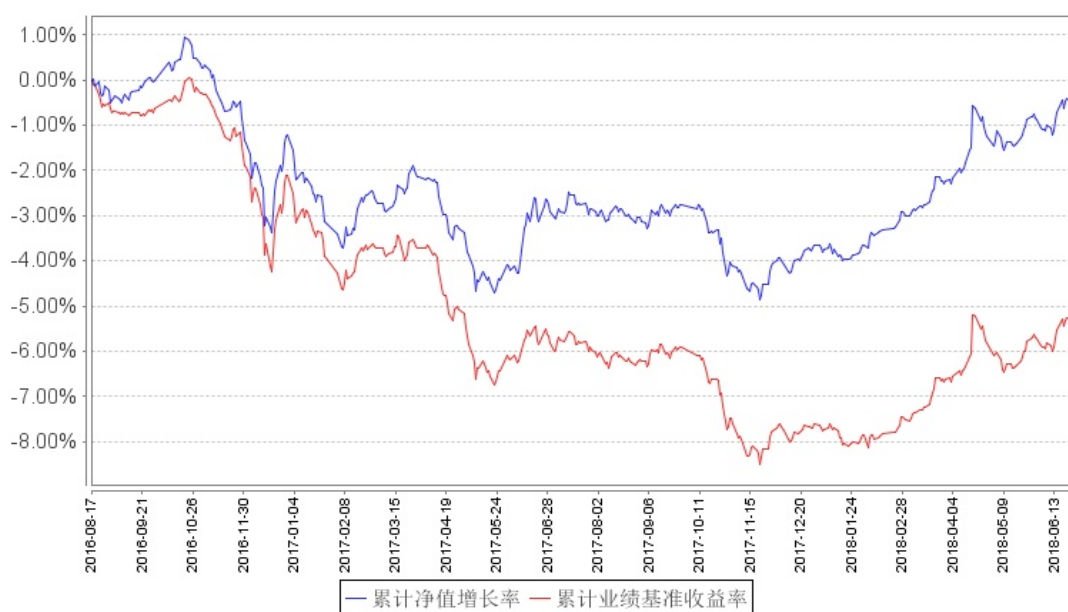
南方10年国债A累计净值增长率与同期业绩比较基准收益率的历史走势对比图