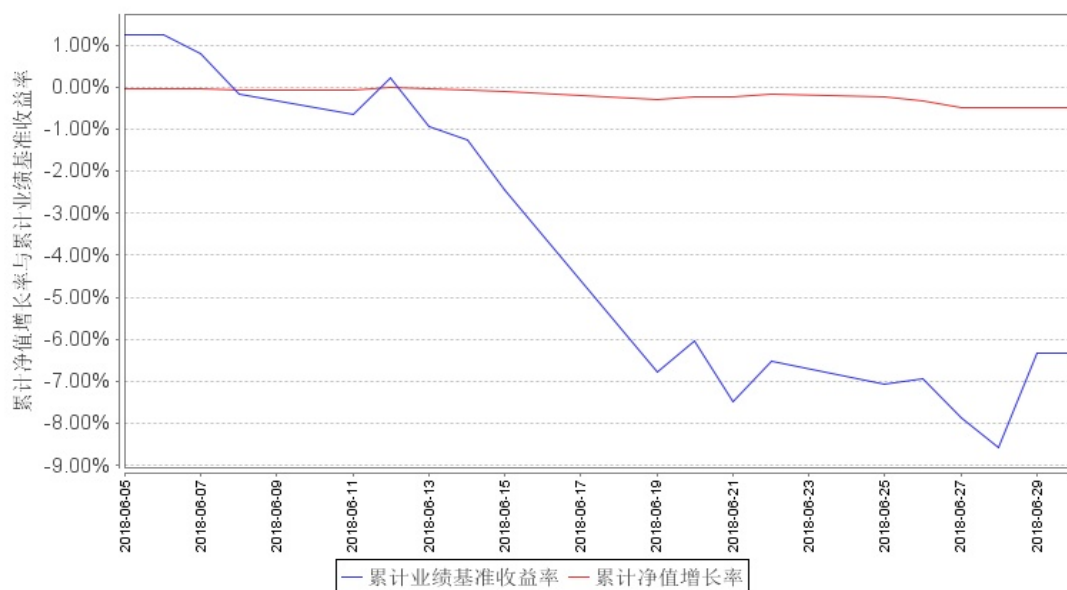
南方新蓝筹混合累计净值增长率与同期业绩比较基准收益率的历史走势对比图

注：1. 本基金转型日期为 2018 年 6 月 5 日，截止报告期末，本基金转型后基金合同生效未满一年。