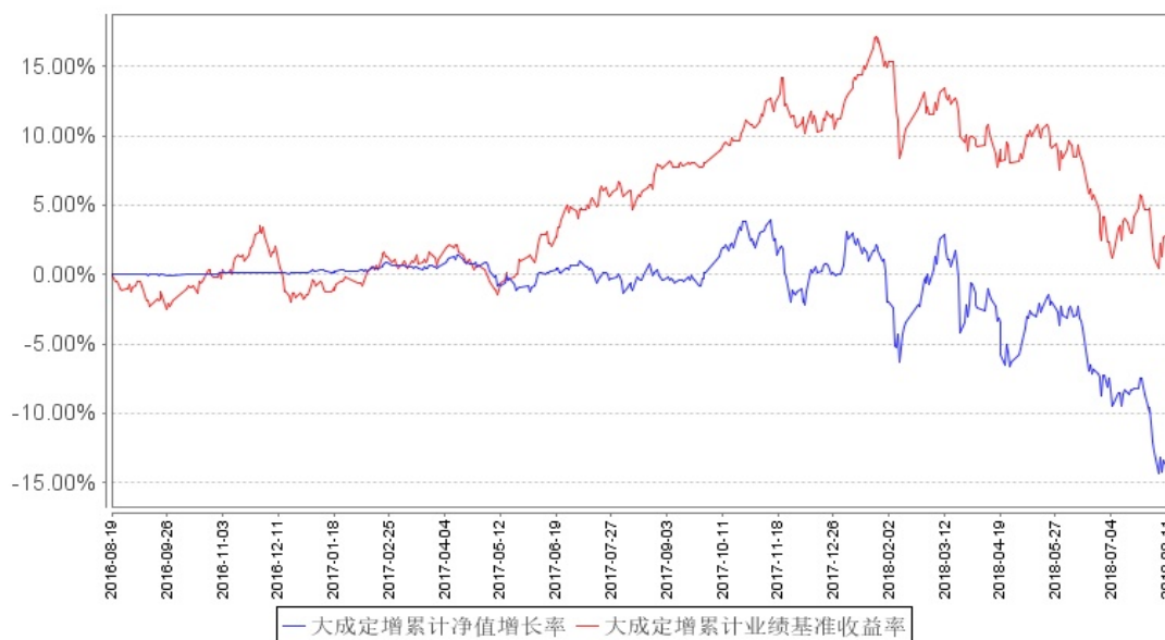
大成定增累计净值增长率与同期业绩比较基准收益率的历史走势对比图

注：按基金合同规定，基金管理人应当自基金合同生效之日起 6 个月内使基金的投资组合比例符合基金合同的约定，截至本基金转型前，本基金投资顺丰控股（002352）因定增股票估值方式变更，导致单个股票的投资比例被动超标。除此之外，报告期内本基金的其他各项投资比例符合基金合同的约定。