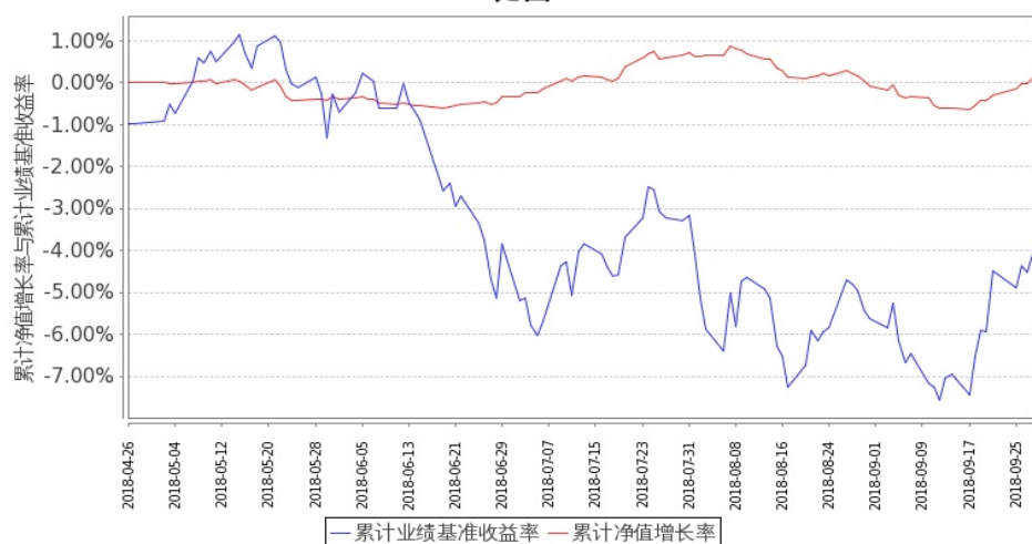
图 2：嘉实新添荣定期混合 C 基金份额累计净值增长率与同期业绩比较基准收益率的历史走势对比图 (2018 年 4 月 26 日至 2018 年 9 月 30 日)

注：本基金基金合同生效日 2018 年 4 月 26 日至报告期末未满 1 年。按基金合同和招募说明书的约定，本基金自基金合同生效日起 6 个月内为建仓期，本报告期处于建仓期内。